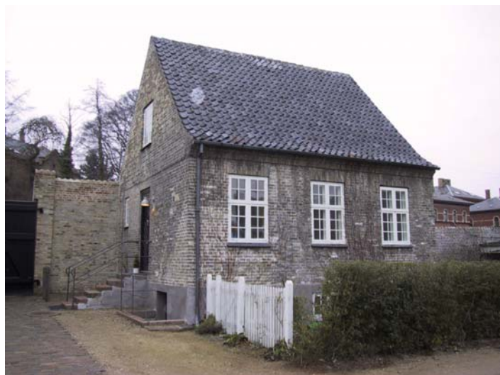
Kustodeboligen - 05

Boligen er opført i 1763 som stald for kommandantens heste. Bygningen indgår som led i husrækken mod Øster Voldgade og er sammenbygget med gademuren.