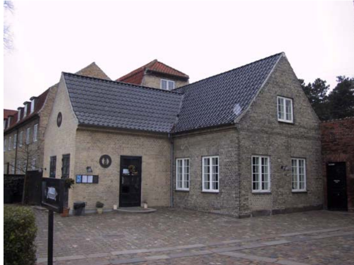
Traktørstedet - 04

Denne lille ét-etages vinkelbygning er opført i gule mursten med undtagelse af gadefacaden som består af røde tegl. Taget er sortglaserede tegl.