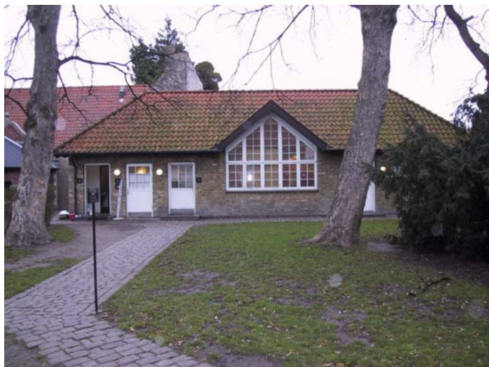
Atelierbygningen – 06

Atelierbygningen blev opført i 1936 primært som fotoatelier for Rosenborg. Bygningen består af én etage med helvalmet sadeltag og i midten af sydfacaden er placeret et større ateliervindue. Facaderne er opført i gule teglsten, og taget er beklædt med røde teglsten.