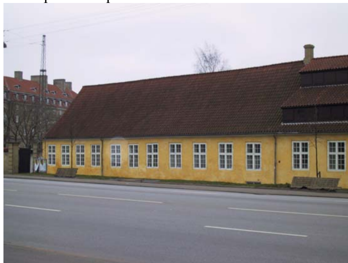
Overvindringshus - 10

I forlængelse af gartnerboligen (09) er denne bygning opført senere, sandsynligvis i begyndelsen af 1700-tallet. Oprindeligt var her indrettet vaskeri samt bolig for vaskekoner, men i dag anvendes huset af gartnerne tilknyttet Kongens Have. Bygningen er opført i én etage med sadeltag. Facaderne er gulkalkede, og taget er belagt med røde tegl. På østsiden er etableret ovenlys. Grundplanen udgør 219 m 2 .