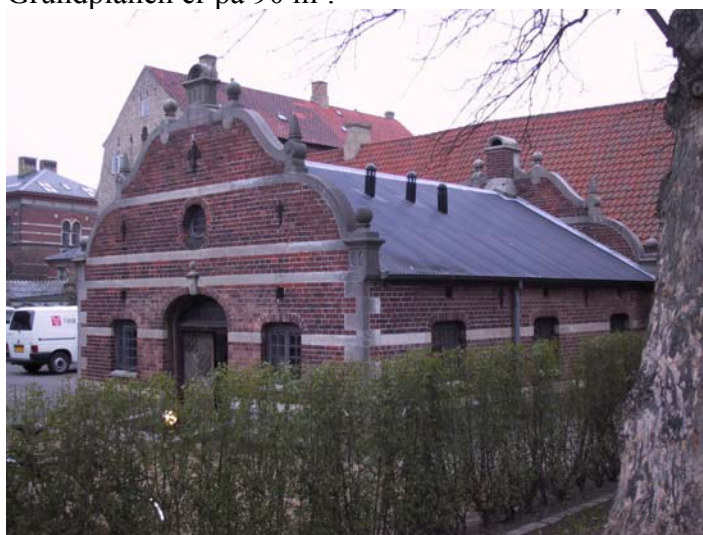
Varmecentral - 07

I 1886 blev denne bygning opført som varmecentral af arkitekt Mel-dahl. Huset er opført i ny renæssancestil med røde teglstensfacader dekoreret med bl.a. sandstensbånd og hjørnekvadrer. Taget er et sadeltag, som sandsynligvis oprindeligt har været beklædt med skif-fer, der i nyere tid er udskiftet med bølgeplader.