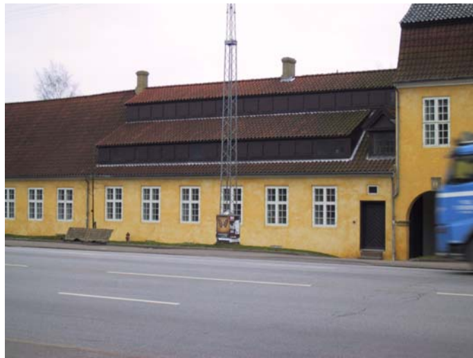
Gartnerboligen - 09

Bygningen er sandsynligvis opført i slutningen af 1600-tallet eller begyndelsen af 1700-tallet som bolig for oldfruen. I dag anvendes boligen som tjenestebolig/lejebolig. Facaderne er pudsede og gulkalkede, mens taget er belagt med røde tegl og forsynet med to rækker luger i hele tagets udstrækning på begge sider. Taglugerne har tidligere strakt sig fire fag længere mod nord og har oprindeligt haft til formål at udlufte tørreloftet. Grundplanen er på 185 m 2 .