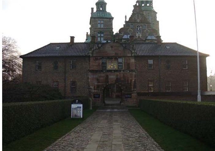
Portbygningen - 02

Den midterste del af bygningen blev opført i 1616 som port ved den nordlige vindebro, mens bygningens sidefløje blev opført ca.1623. Selve midterporten er opført i sandsten, mens sidefløjene fremstår i blank mur i to typer tegl. Den nordlige del er opført i gule teglsten, mens den sydlige del er opført i røde tegl. Begge typer har munkestensformat, og i starten af 1700-tallet var begge fløje oliemalet, sandsynligvis i en stengrå nuance. Bygningen er opført i to etager med helvalmet (hhv. tagskæg i samme niveau) og opskalket (kileformet træstykke på tværs af et spærs tagfod) sadeltag belagt med sort-glaserede tegl. Grundplanen udgør 169 m 2 .