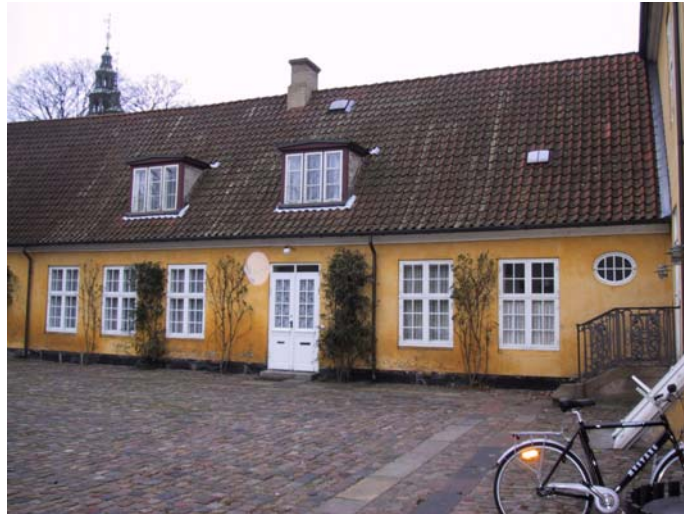
Sidehus - 11

Bygningen er formodentlig opført samtidig med forhuset i 1688 og har oprindeligt været anvendt som køkken i tilknytning til forhuset. Siden 1923 har bygningen været indrettet som bolig med delvist udnyttet tagetage. Bygningen er opført i én etage med gulkalkede facader og rødt tegltag med kviste. Grundplanen udgør 112 m 2 .