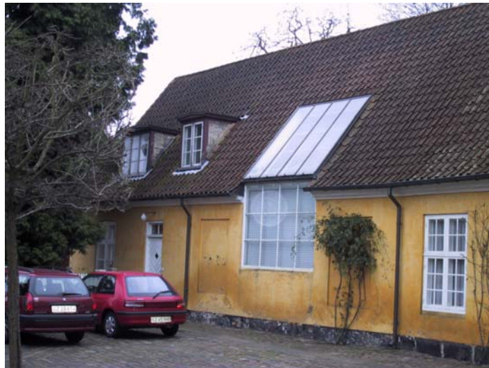
Baghus - 12

Bygningen er efter al sandsynlighed opført samtidig med sidehuset og placeret i forlængelse heraf. Oprindeligt var bygningen indrettet som hestestald. Den er opført i én etage med gulkalkede facader og rødt tegltag med kviste. Mod nord er placeret et større ateliervindue i tag og facade, som stammer fra tiden, hvor kunstmaler Lauritz Tuxen havde atelier i bygningen. Siden 1970'erne har stedet været anvendt til gobelinværksted og øvrige faciliteter for Rosenborgs personale. Grundplanen er på 139 m 2 .